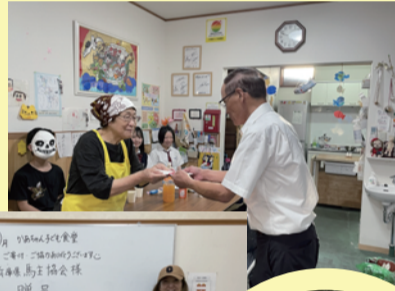
→子ども食堂晴れるやに机2台を贈呈。尼崎かあちゃんこども食堂